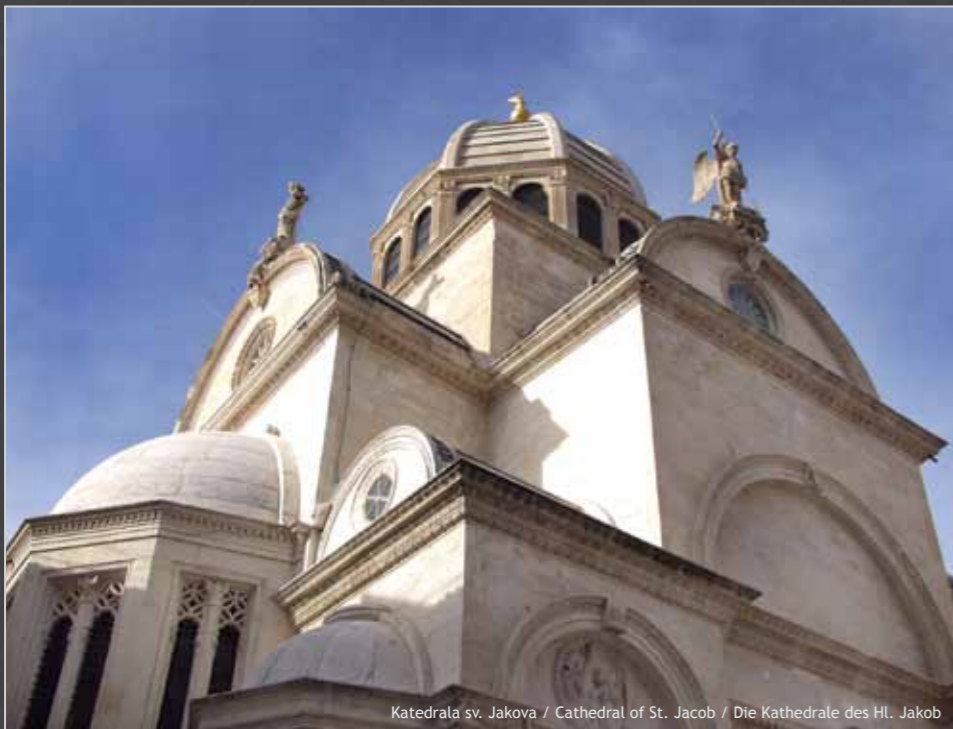
Katedrala sv. Jakova / Cathedral of St. Jacob / Die Kathedrale des Hl. Jakob

Skradin i Šibenik, prijestolnice starohrvatskih kraljeva, stameni svjedoci slavne prošlosti, danas zrače svojom osobnošću.