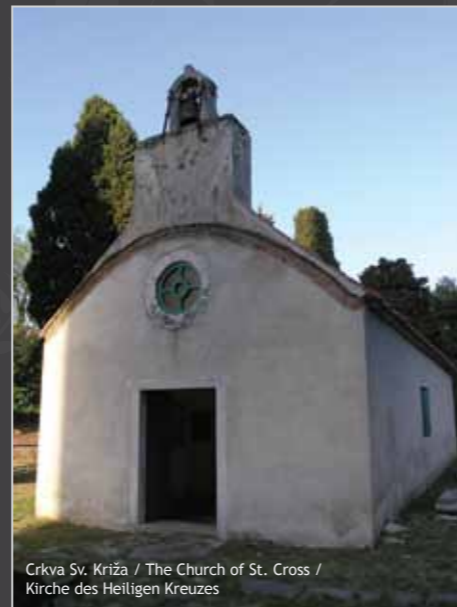
Crkva Sv. Križa / The Church of St. Cross / Kirche des Heiligen Kreuzes