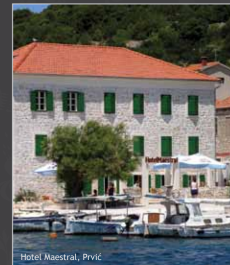
Hotel Maestral, Prvić