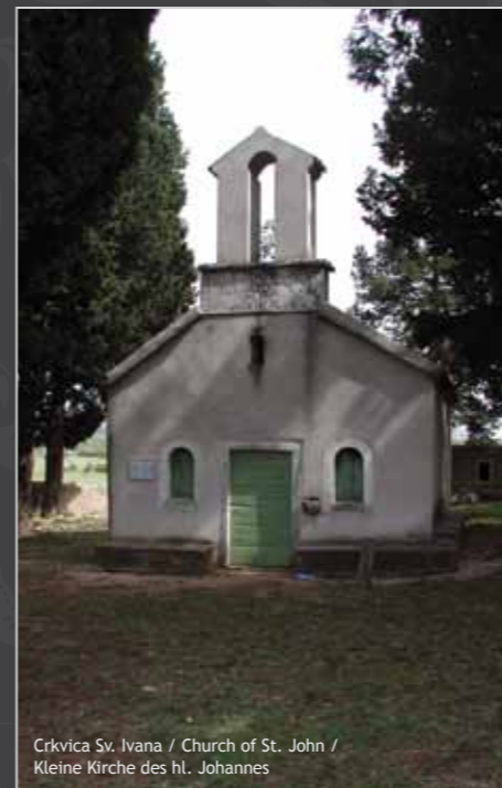
Crkvice Sv. Ivana / Church of St. John / Kleine Kirche des hl. Johannes