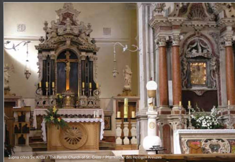
Župna crkva Sv. Križa / The Parish Church of St. Cross / Pfarrkirche des Heiligen Kreuzes