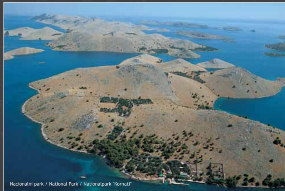
Nacionalni park / National Park / Nationalpark "Kornati"

“Posljednjeg dana stvaranja svijeta Bog je želio okruniti svoje djelo i tako je stvorio Kornate prosušivši suze, zvijezde i uzdahe.”